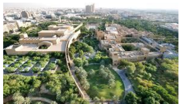
Saudi Green Initiative