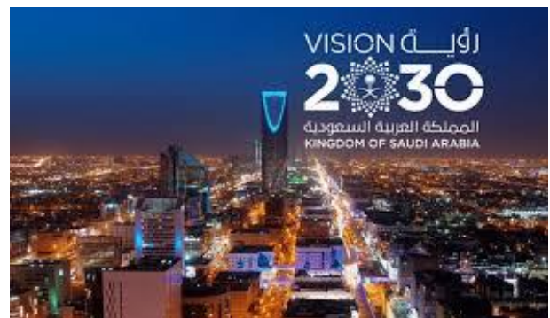
Saudi Vision 2030

Non solo. Il Paese ha investito molto negli anni scorsi per contrastare la storica scarsità di acqua, realizzando progetti ambiziosi nella dissalazione dell'acqua marina, trasformandola in una risorsa vitale. Nel 2023, la capacità globale di dissalazione è di 109,2 milioni di metri cubi al giorno; l'Arabia Saudita rappresenta il 15% di tale capacità e soddisfa il 75% della domanda di acqua potabile civile.